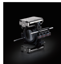
VXD (Voice-coil eXtreme-torque Drive, entraînement à couple extrême et bobine acoustique) : moteur linéaire pour autofocus

Le 150-500mm F/5-6.7 dispose d'un autofocus VXD 2 avec un moteur linéaire puissant. Les avantages de la technologie VXD résident dans la grande vitesse et dans la précision de la mise au point. L'autofocus est très réactif et est capable de capter les événements sportifs, les véhicules rapides, les animaux sauvages ou les oiseaux avec une fiabilité absolue. Le fonctionnement du moteur linéaire est peu bruyant et pratiquement sans vibration ce qui rend l'objectif utilisable en vidéo.