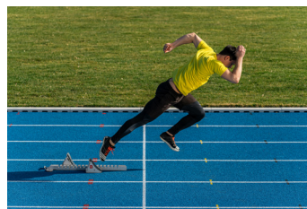
Focale : 150mm | Exposition : 1/2000 s, F/5.6, ISO 500