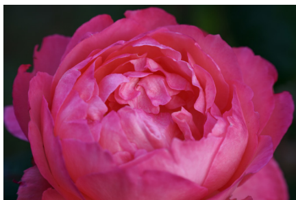
Focale : 150mm | Exposition : 1/100 s, F/8, ISO 400

Le 150-500mm F/5-6.7 Di III VC VXD (modèle A057) ne fournit pas seulement une grande qualité de l'image mais il délivre aussi un grand confort d'utilisation. Malgré l'imposante focale de 500mm, sa longueur de 209,6 mm et son diamètre maximal de 93 mm rendent sa manipulation confortable. Le premier ultra-téléobjectif de Tamron pour appareils photo système sans miroir à équipé d'un stabilisateur d'image VC qui permet de prendre des photos nettes à main levée à 500 mm. La formule optique inclut 25 éléments dans 16 groupes, parmi lesquels plusieurs verres spéciaux dont le revêtement BBAR-G2 1 qui minimise les reflets à l'intérieur de l'objectif tout en empêchant les effets de lumière parasite qui apparaissent lors des prises à contre-jour. A 150 mm, la mise au point minimale est de 0,6 m ce qui permet à l'objectif des prises de vue rapprochée impressionnantes. Il très polyvalent, de la photographie de paysage à celle de sport en passant par photo animalière..